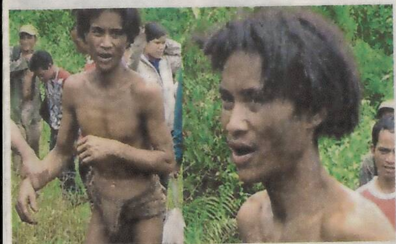
En Vietnam un papá y su hijo vivieron años como salvajes .WWW.MITUNJA.NET

En los últimos años, Pnhieng ha vivido encerrada la mayor parte del tiempo en una pequeña cabaña en la parte posterior de la casa de su familia adoptiva, una solución re-