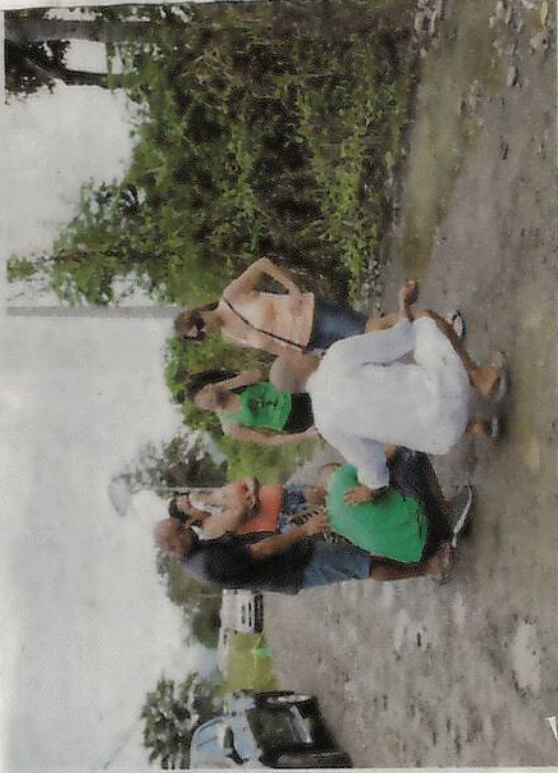
La familia afirma que todo se debió a un problema pasional. WILBERT HERNÁNDEZ

De cinco a seis hombres que se tapaban la cara con pasamontañas hijos estaban reventando umas