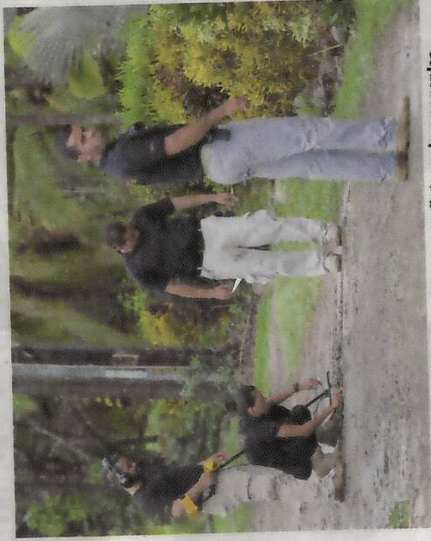
La calma se fue de Pueblo Real, un lugar tranquilo tomado ayer por los agentes del OIJ. WILBERT HERNÁNDEZ

La situación ocurrió este domingo a las 9 p. m. en Pueblo Real de Damas, a unos 5 kilómetros del centro de Quepos.