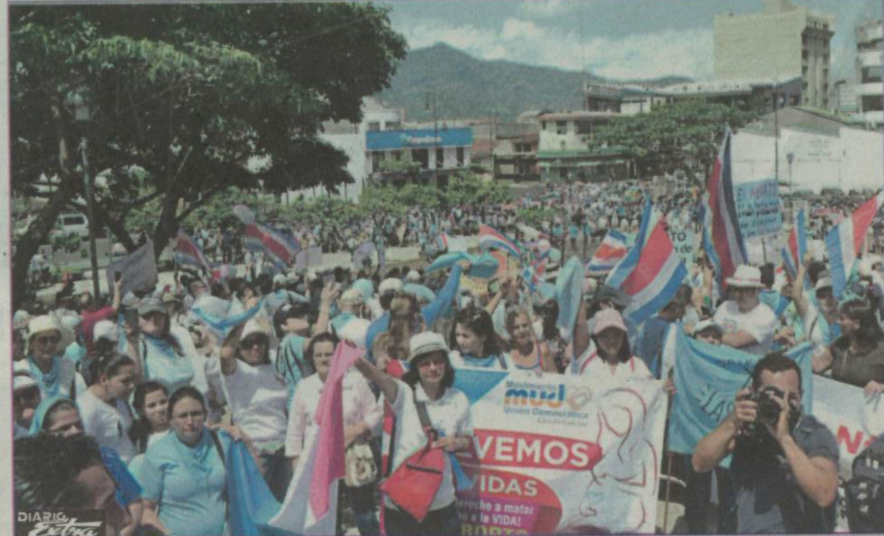
Tomaron Plaza de la Democracia, donde reiteraron las razones por las cuales están contra el aborto.