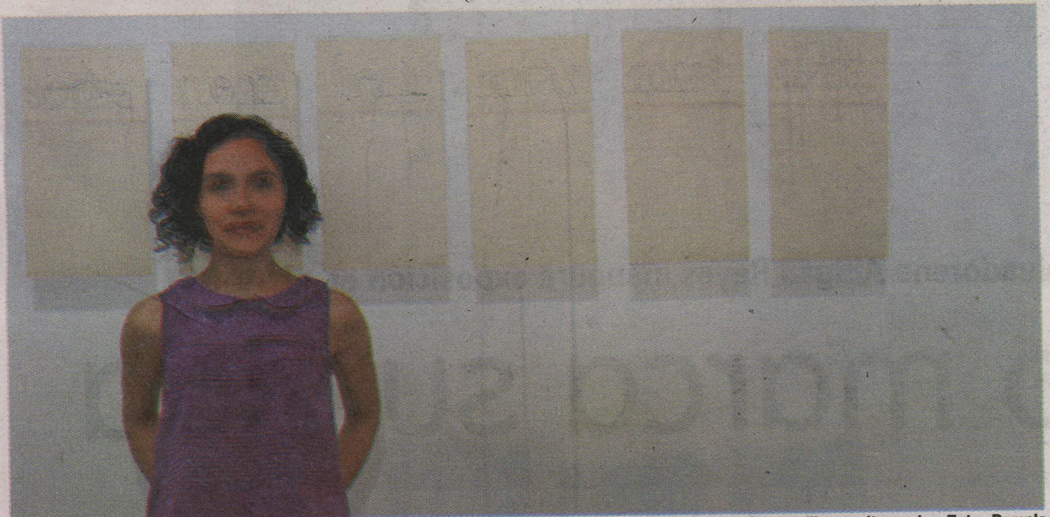
Se considera poco complicada para la interpretación de lo que ella quiere mostrar, pero entre más sencillo resulte, mejor.

Reyes se siente complacida de estar en el país y espera regresar pronto con otras propuestas.