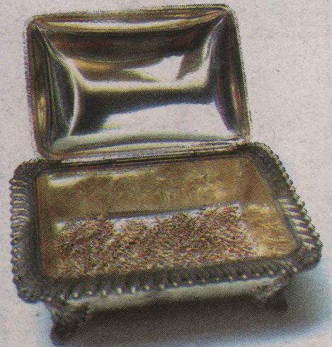
Además, presenta otro tipo de objetos en el marco de la misma exposición.

Todo el montaje que se verá en este espacio forma parte también de la herencia de tejedoras, pues muchas de las mujeres de generaciones pasadas en su familia aprendieron a coser y tejer; por años llevaron el sustento al hogar de este modo.