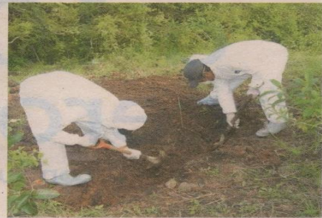
El hueco donde estaba el cuerpo no era muy profundo.