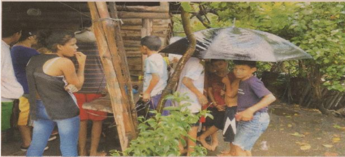
Varios amigos y familiares de la jovencita llegaron a apoyar a la familia.