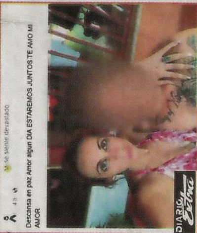
Descansa en paz Amor algún día ESTAREMOS JUNTOS TE AMO MI AMOR