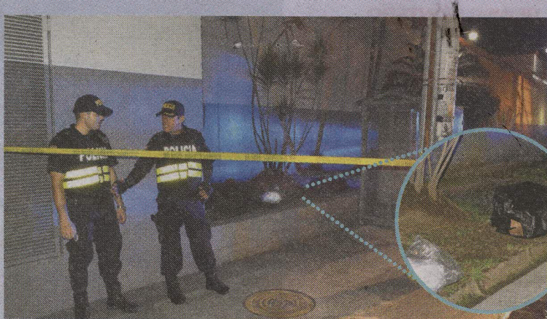
La respuesta rápida de los policías de Alajuela salvó a los niños. El OIJ recogió pruebas. FRANCISCO BARRANTES