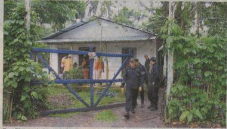
Familiares de los desaparecidos llegaron ayer a la casa. R. MONTERO