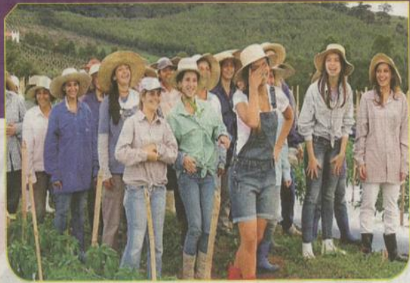
El territorio tiene una población de 600 damas. (SEP)

En 1995 Pereira muere y luego de ello las mujeres decidieron que jamás permitirían a un macho que les