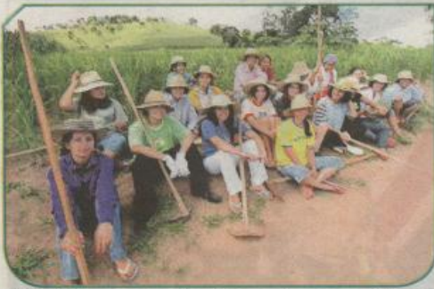
Allí los hijos se marchan a los 18 años y los pocos maridos solo permanecen los fines de semanas. (SEP)

B RASIL (SEP).- El sueño de las Amazonas se hizo realidad, pues resulta que una ciudad brasileña está habitada en su exclusividad por mujeres jóvenes, muy atractivas, que han hecho un llamamiento desesperado, buscan hombres solteros.