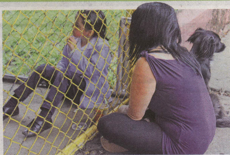
Doña Norma le pasa el almuercito a la hija y a la sobrina.

ESTIMADOS PADRES, MADRES Y ENCARGADOS DE FAMILIA: