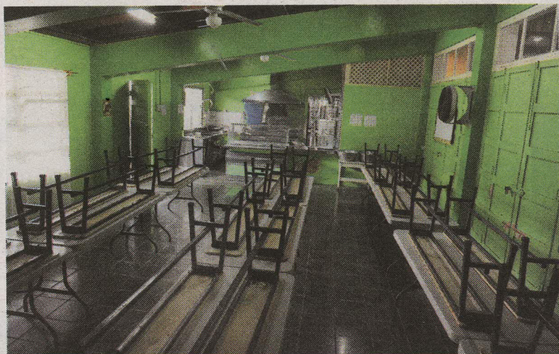
El comedor de la escuela Naciones Unidas pasa vacío todo el día.