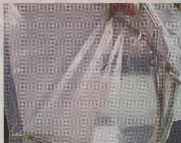
La Policía decomisó el cable. ALFONSO QUESADA

do pero el hombre salió con un cable eléctrico en la mano y no me dejaba pasar. Yo le dije que no me pagara nada, que me dejara tranquila y seguí y entonces me dio varias veces con el cable por la espalda”, contó Josefa.