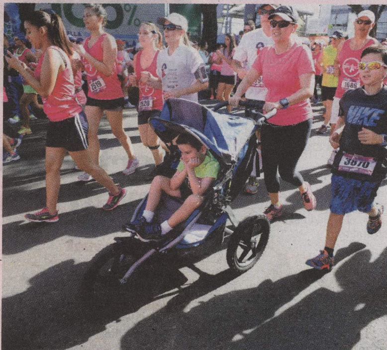
Familias enteras se apuntaron a la carrera Anna Ross 2015. DIANA MÉNDEZ.

También se realizó una caminata de dos kilómetros.