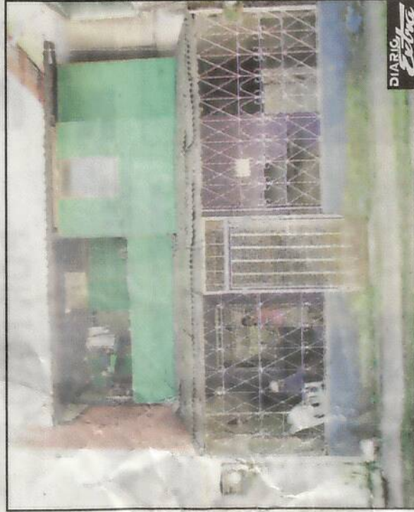
En esta humilde vivienda se dio la agresión: un hombre apuñaló a su esposa que falleció una semana después.