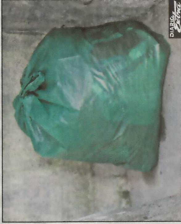
Que su esposa le pusiera la ropa en una bolsa plástica habría sido una de las causas por las que el hombre enfureció.