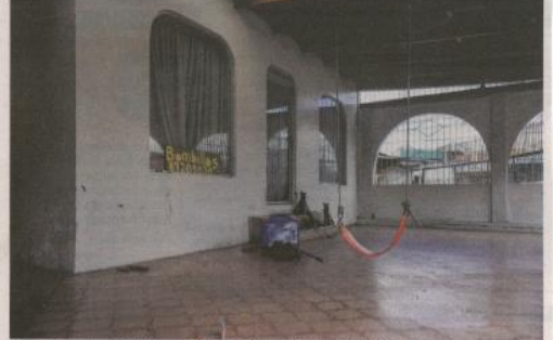
La casa donde ocurrió el crimen les trae recuerdos dolorosos a los vecinos de la López Mateos. (10/11/04)

Controlado. Una de las psicólogas de la oficina de Planes y Opera-