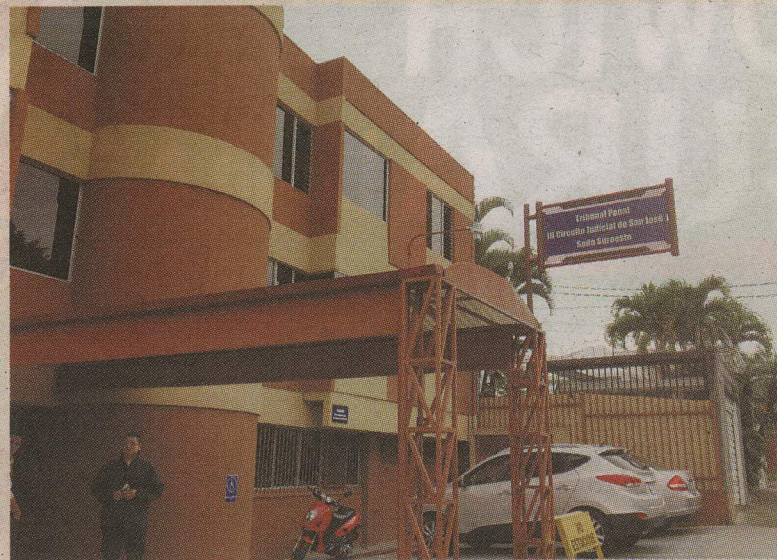
La mamá quedó en libertad, pero sin su hija.