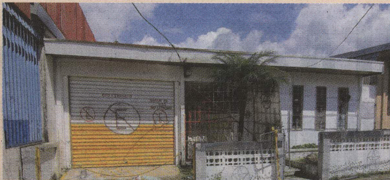
Puede verse que las pequeñas ventanas tenían plásticos. JEFFREY ZAMORA

En la casa había dos niños (de seis y dos años) y dos chiquitas (de cuatro años y de tres meses); todos