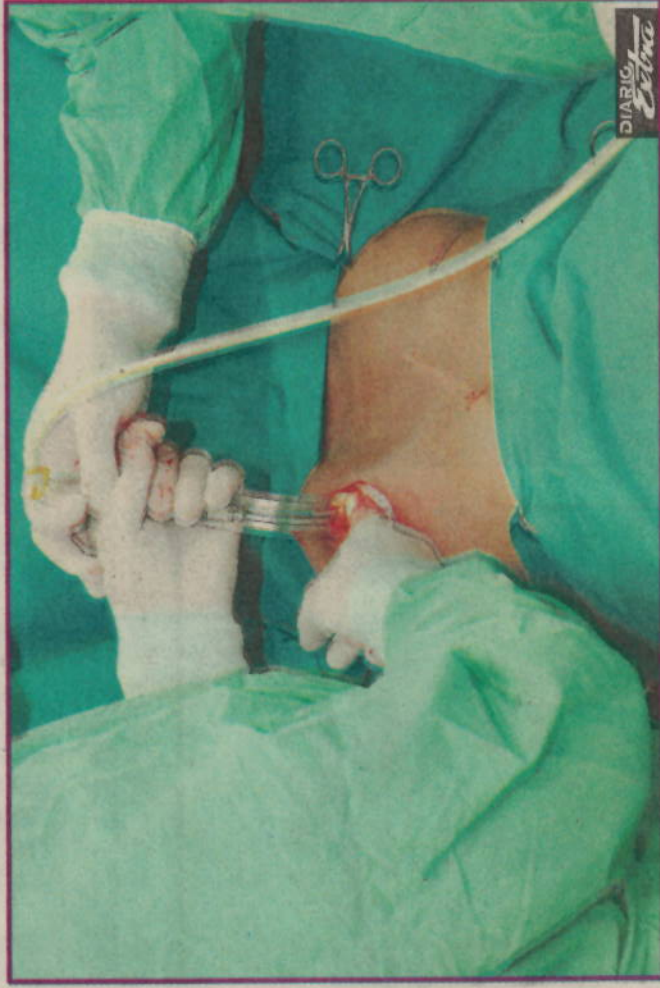
Los médicos indican que la detección temprana del cáncer es curable en un 95%.

"Lo ideal es encontrar casos en estos tempranos, pues, en esa etapa, la curación es más alta, además de que no habrá ningún tipo de secuela física, de ahí que es importante que toda paciente después de los 35 años se realice una valoración especializada por un senólogo, que se haga su mamografía y un ultrasonido. Esta revisión debe hacerse una vez al año y, si eventualmente aparece una lesión, pueda ser detectada a tiempo. En ese caso la sobrevivencia es