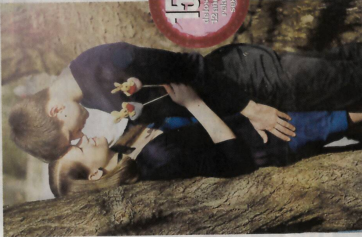
Ahora los padres permiten los noviazgos desde los 12 años.

"Supe el caso de dos niños de primer grado que estaban viendo cómo conquistaban a otra compañerita y pidieron asesoría a sus padres y abuelos si debían pegarle al 'rival' y los abuelos les aconsejaron no pelear, sino más bien llevarle flores a la niña. Si bien el consejo de no recurrir a la violencia estaba bien, no corresponde para la etapa en la que están los niños", explicó Vargas con toda razón.