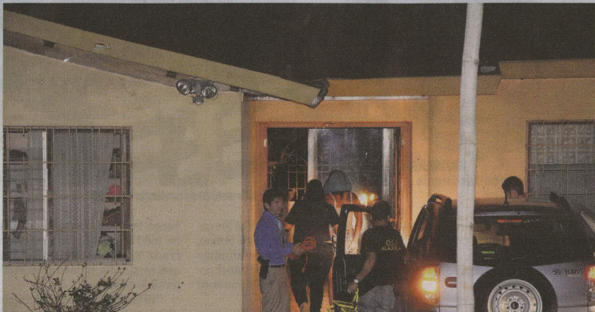
La mujer de apellido Venegas vivía a la par de la casa en la que mataron al empresario. FRANCISCO BARRANTES