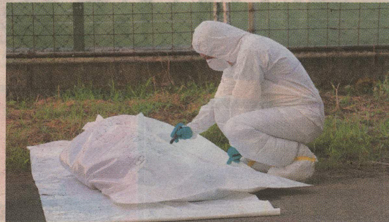
Al parecer, la mujer era víctima de violencia doméstica. REINER MONTERO.