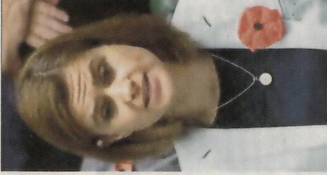
Jo Cox en una sesión parlamentaria, en noviembre del 2015.

"Es un ataque contra todos aquellos para quienes la demo-