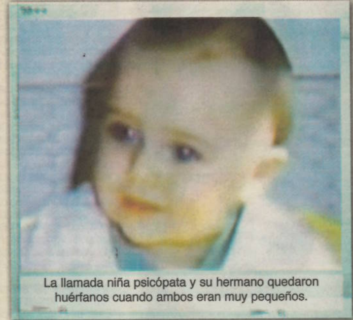
La llamada niña psicópata y su hermano quedaron huérfanos cuando ambos eran muy pequeños.