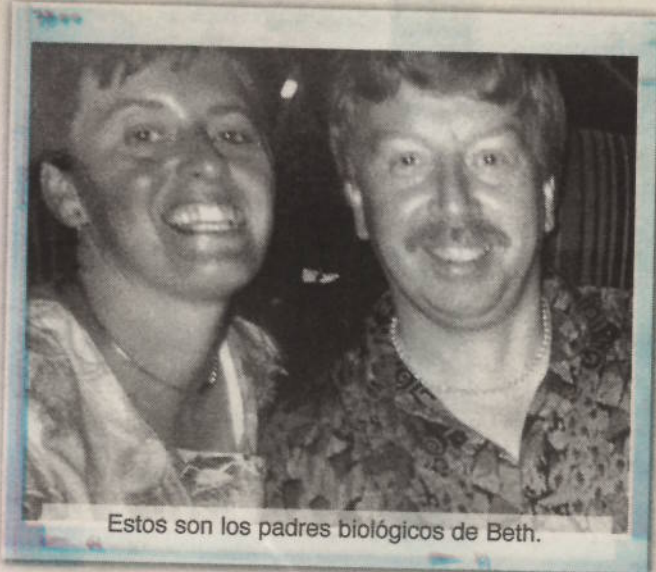
Estos son los padres biológicos de Beth.