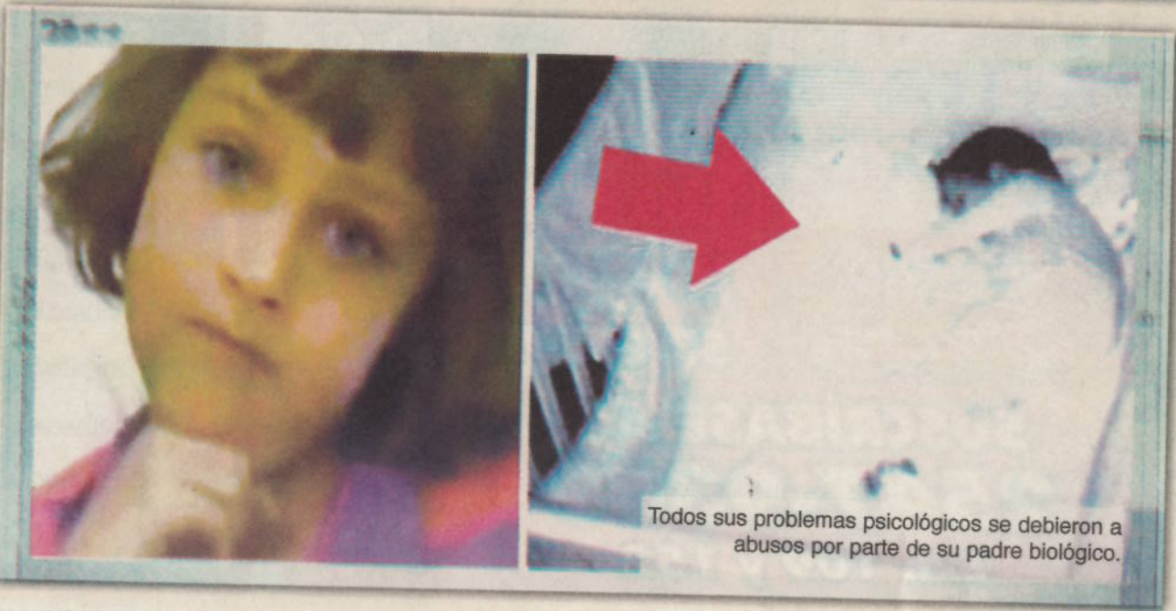
Todos sus problemas psicológicos se debieron a abusos por parte de su padre biológico.