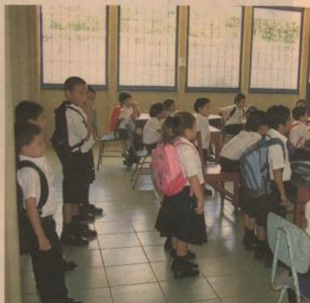
¿Se cumple el objetivo? El Gobierno carece de instrumentos para evaluar si Avancemos, que otorga becas para estudiantes pobres, cumple con su objetivo. La ausencia de una rectoría del área social falsea a otros 43 programas.

Carlos Umaña, economista de la Academia de Centroamérica, agregó que la falta de visión estratégica a largo plazo que adole-