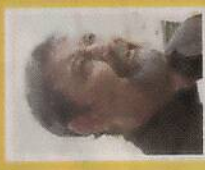
GUSTAVO MATA MINISTRO NATALIA RODRIGUEZ

“El nombre no es tan importante como las características físicas y otros datos”.