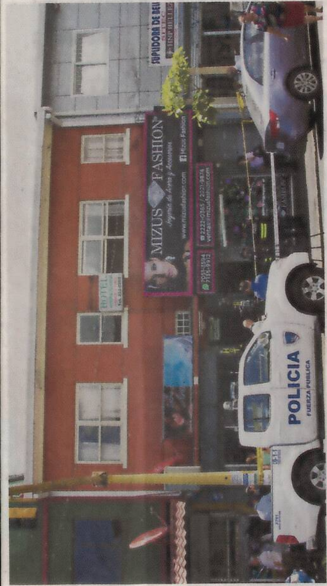
El hotel (paredes anaranjadas) puede pasar inadvertido desde la acera. NATALIA RODRIGUEZ

“Por como estaban los cuerpos parecía que primeros los acomoda-