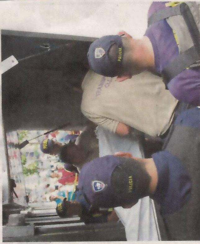
Los dos cuerpos fueron sacados a eso de la 1 p. m. NATALIA RODRIGUEZ