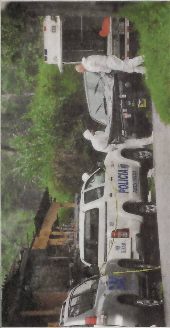
Los agentes del OIJ realizaron el levantamiento avanzada la tarde, bajo un fuerte aguacero. ■ MELISSA FERNÁNDEZ

La madre estaba en una banca, cerca de una puerta que da al patio y tenía marcas de machete