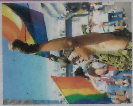
Estas personas solamente piden derechos igualitarios.

Meduele mucho que la sociedad dure tanto para evolucionar".