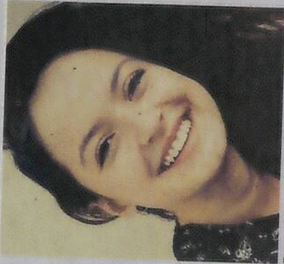
Para Darian, la educación es clave para superar la discriminación.