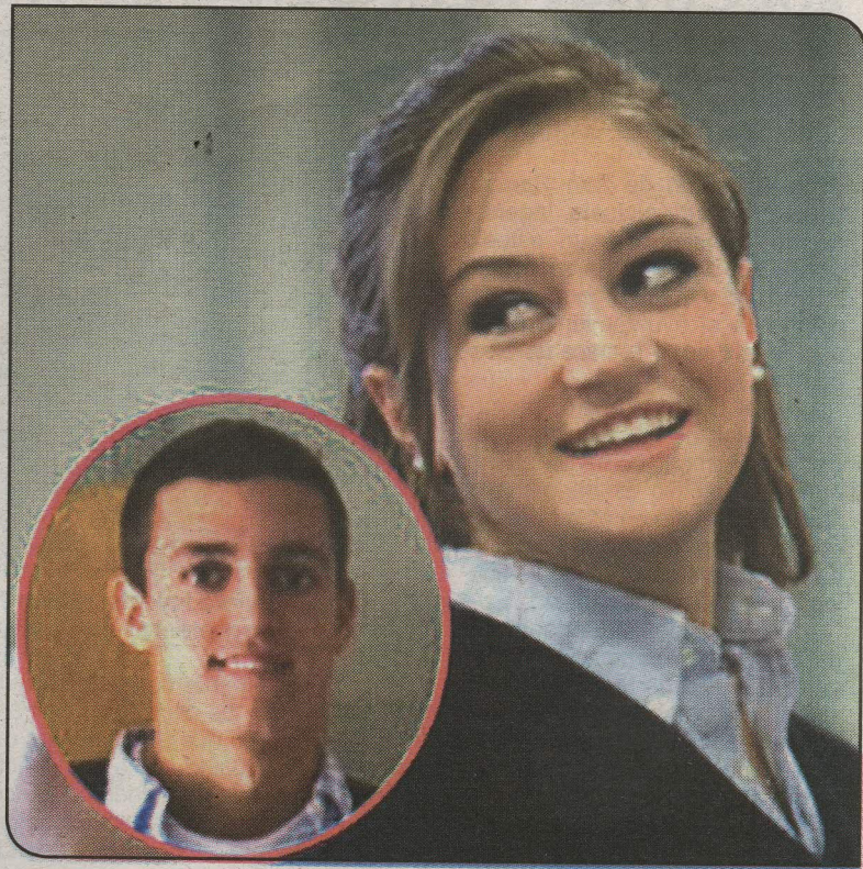
Uno de los problemas principales ha sido negarse a separarse de su novio, ya que según los padres no es más que un fracasado y un mal ejemplo para la joven. (SEP)

La quieren de vuelta y no comprenden qué está pasando, por qué tanta publicidad.