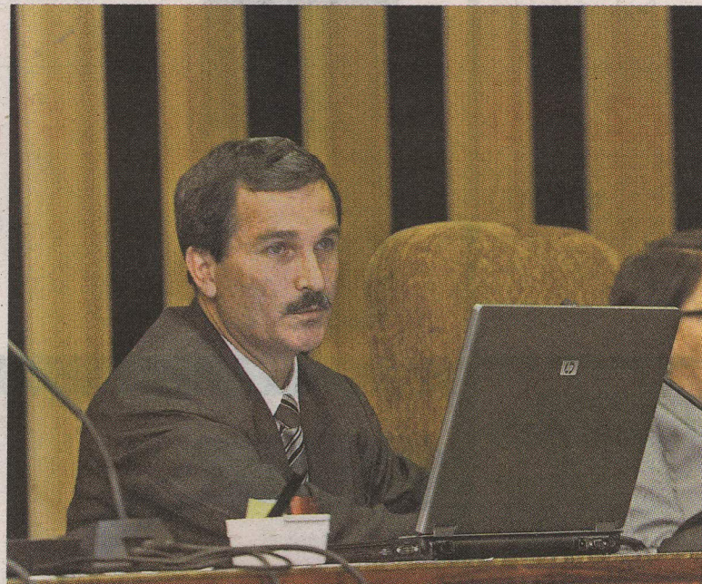
Al magistrado lo denunciaron el año pasado.

La Corte ya había encontrado responsable al magistrado y pidió a la Asamblea Legislativa que lo destituyera pero una acción de inconstitucionalidad suspendió dicho proceso.