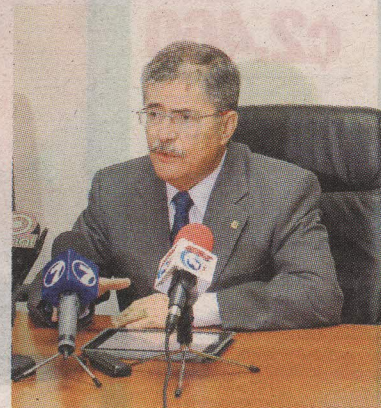
Los abogados de la jueza presentarán la querrela antes del 9 de octubre. S.COTO

“Ella es una mujer decidida, dispuesta a romper el silencio. Para ella vienen tiempos difíciles por que la van a revictimizar y ella lo sabe, pero ella está empezando un camino de valentía, fortaleza espiritual y sabemos que al final la justicia le dará la razón”, dijo Castro, quien asegura que dará una dura pelea porque 82% de los delitos sexuales quedan sin castigo.