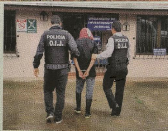
Al sospechoso, de apellido Umaña, lo agarraron mientras sembraba tiquizque.