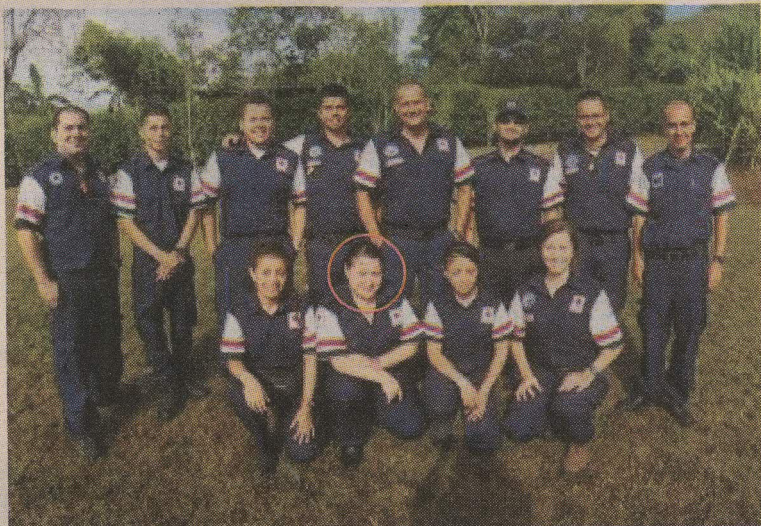
Hace un año la víctima se unió a la Cruz Roja.