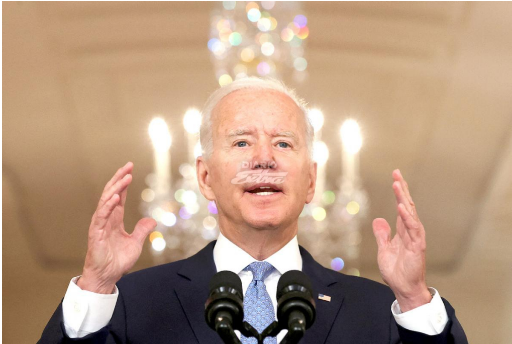
El presidente Joe Biden prometió defender el derecho de las mujeres al aborto

Washington. (AFP) - El presidente de Estados Unidos, el demócrata Joe Biden, prometió defender el derecho de las mujeres al aborto y criticó duramente una ley extremadamente restrictiva que entró en vigor en el sureño estado de Texas.