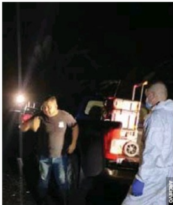
El cuerpo estaba enterrado a 1,5 kilómetros de la casa de su novia.

19 agosto 2021 +1 más Adrián Galeano Calvo adrian.galeano@lateja.cr