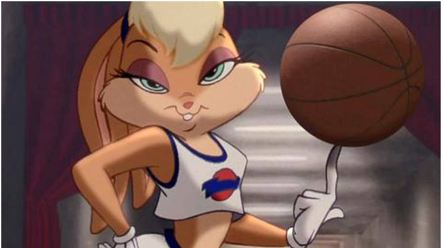
Así lucía Lola Bunny en la primera película de 'Space Jam'.

De acuerdo con Lee, la intención con el rediseño para la nueva película era “reflejar la autenticidad de los personajes femeninos fuertes y capaces”.