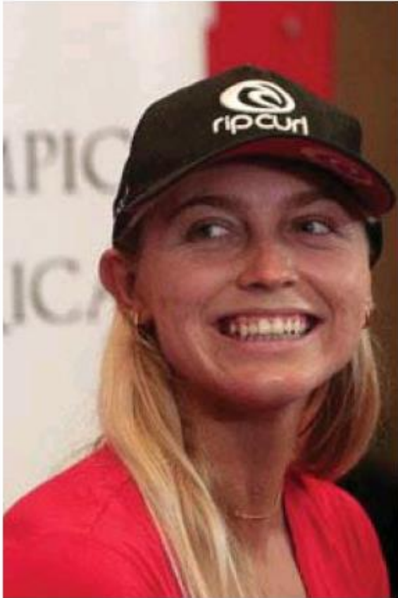
La atleta es pura felicidad por el logro.

ximo provecho, pero dependen de que el mar, en ese ratico asignado, haga olas buenas. De lo contrario, aunque haya tenido una gran preparación, no habrá buen puntaje.