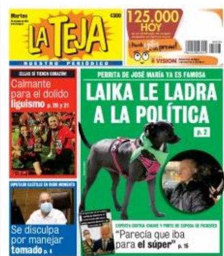
La Teja 8 jun. 2021 (22)