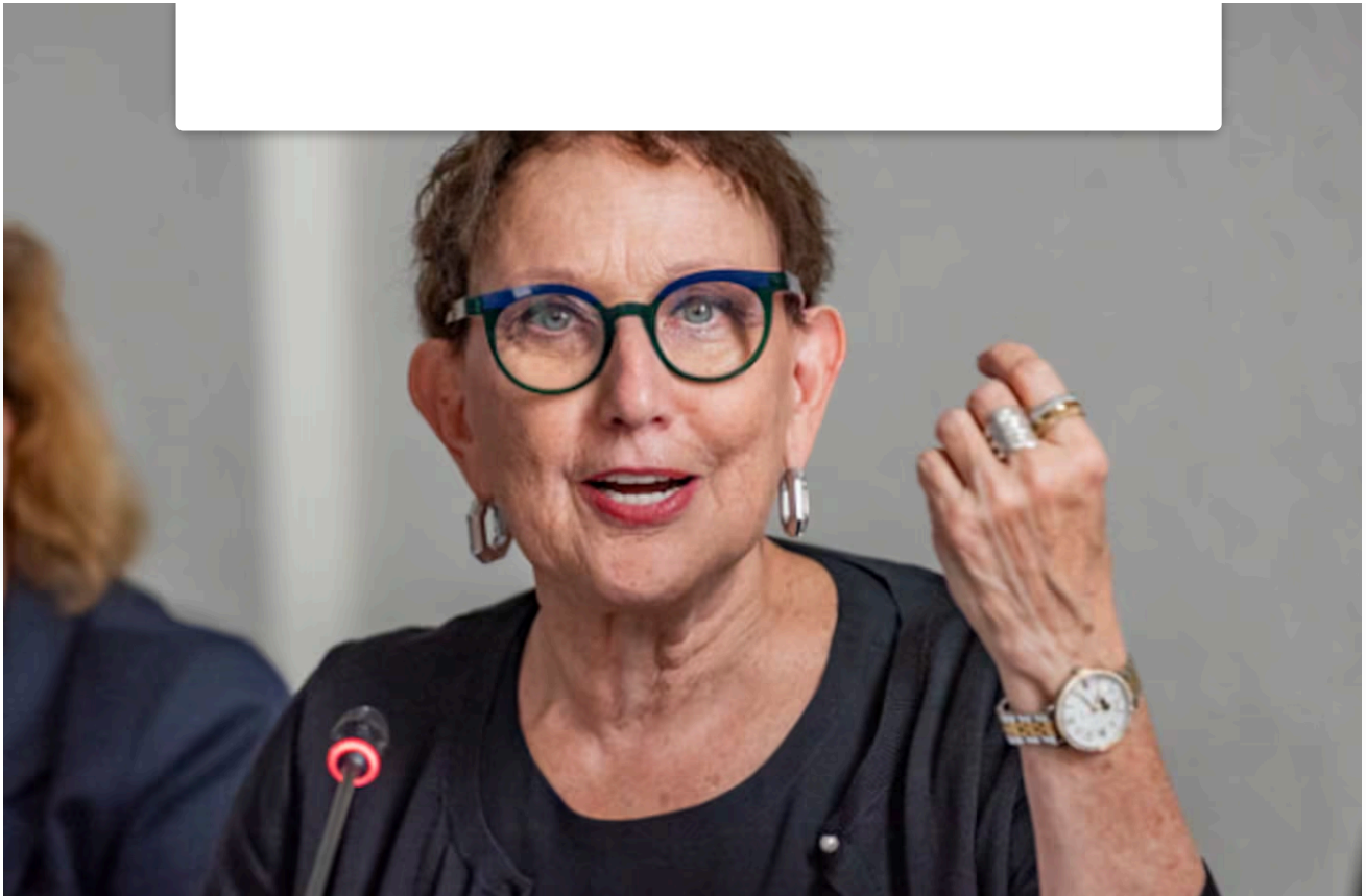
Rebeca Grynspan es secretaria general de la Unctad y exvicepresidenta de Costa Rica.