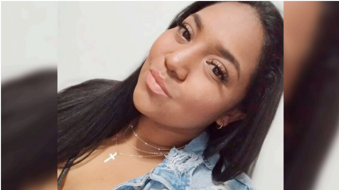
Lagos era madre de una menor de 8 meses.