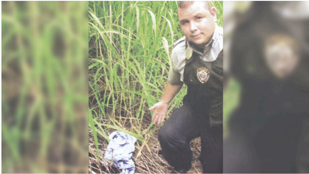
El oficial encontró parte de la ropa de Esquivel.