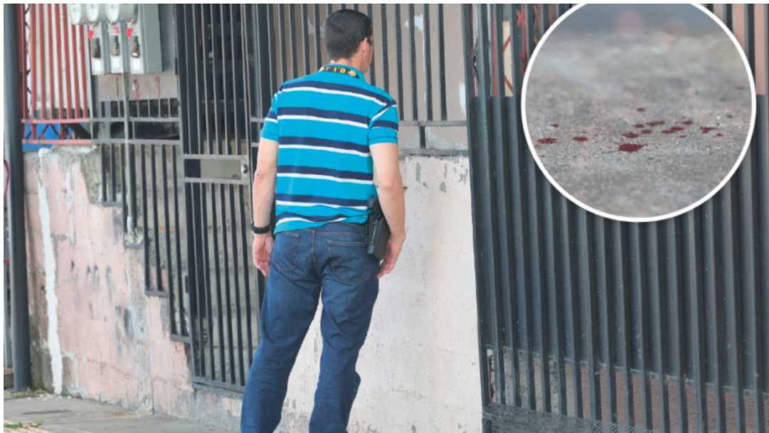
El OIJ llegó a la vivienda donde ocurrió el suceso. • Randall Sandoval