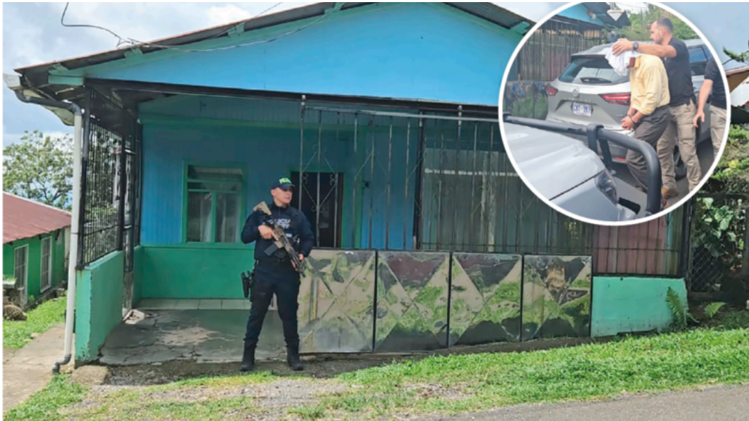
El oficial fue detenido al salir de una audiencia.