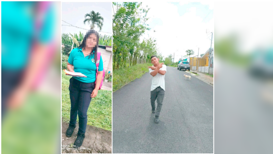
Desapareció desde el 26 de abril.