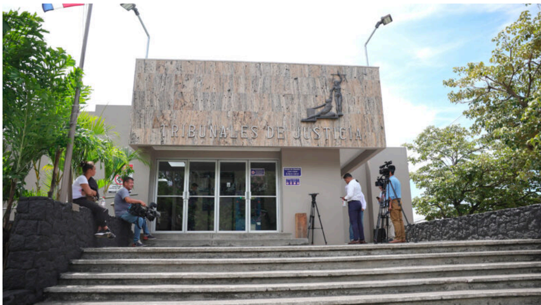
Audiencia por desaparición de Rashad García se desarrolla en Atenas.