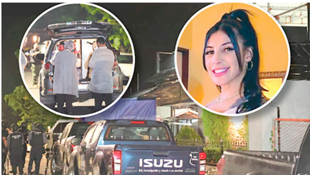
La Policía Judicial encontró restos de Rashab. • Randall Sandoval