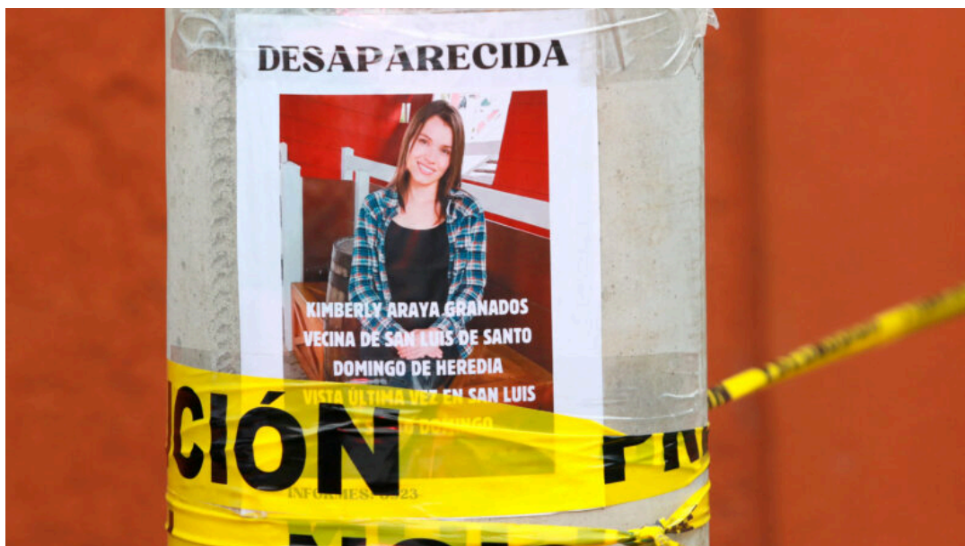
Los familiares realizaron búsqueda.