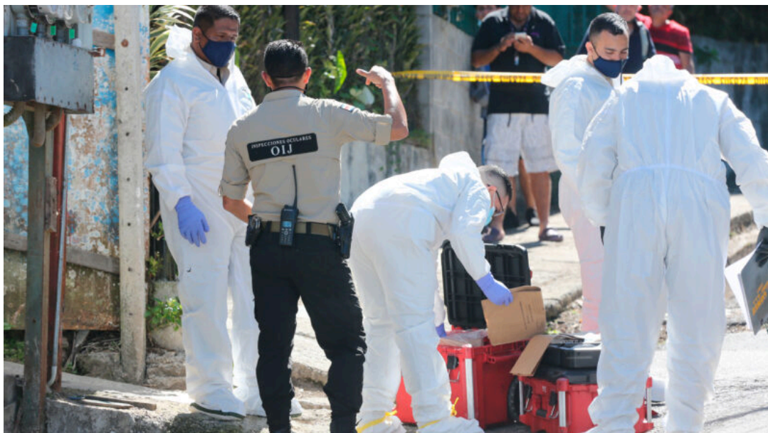
Corte señala falta de recursos para fortalecer base de datos genética Codis.