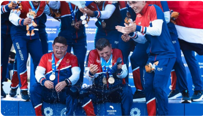
Costa Rica se baña en oro y plata en hockey sobre césped