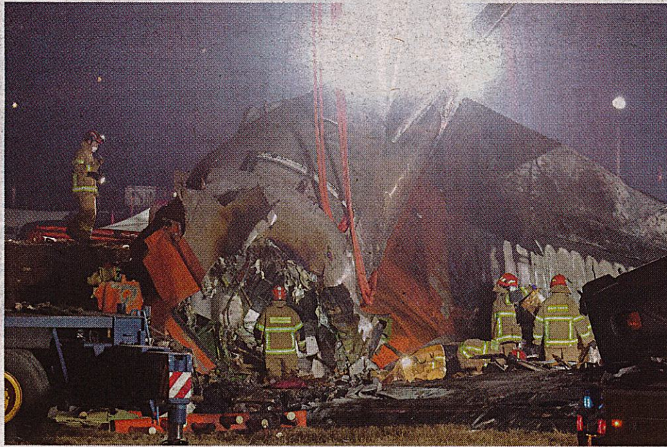
Autoridades señalaron que colisión con pájaro pudo ser la causa del incidente.

“Cuando me desperté, ya me habían rescatado”, declaró a los médicos uno