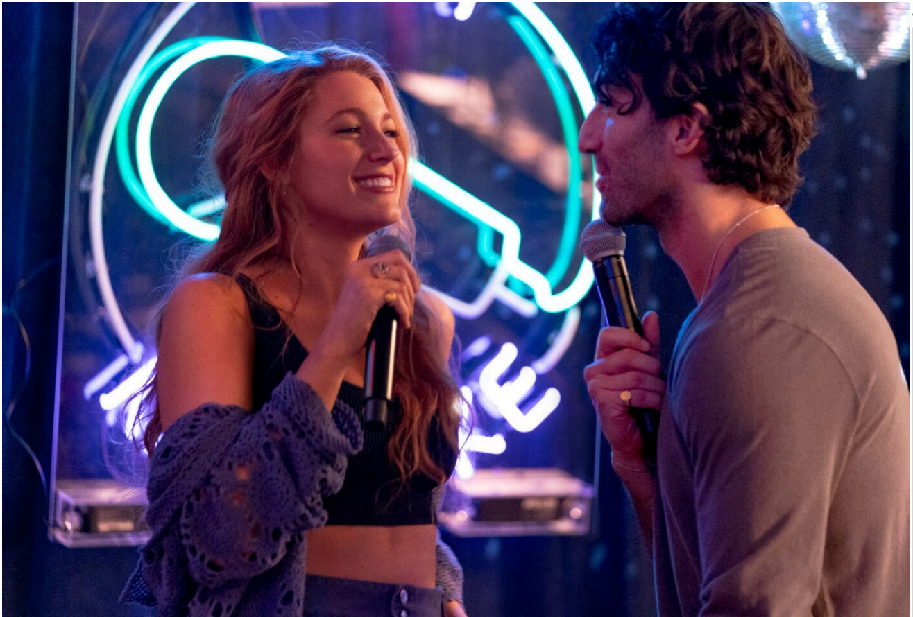
La adaptación cinematográfica de 'Romper el círculo' está protagonizada por Blake Lively y Justin Baldoni.

Blake Lively demandó por acoso sexual a Justin Baldoni , su director y coprotagonista en la película Romper el círculo . Según informó la revista People , la artista alegó en la presentación judicial que las conductas de Baldoni en el set le causaron una “grave angustia emocional”.