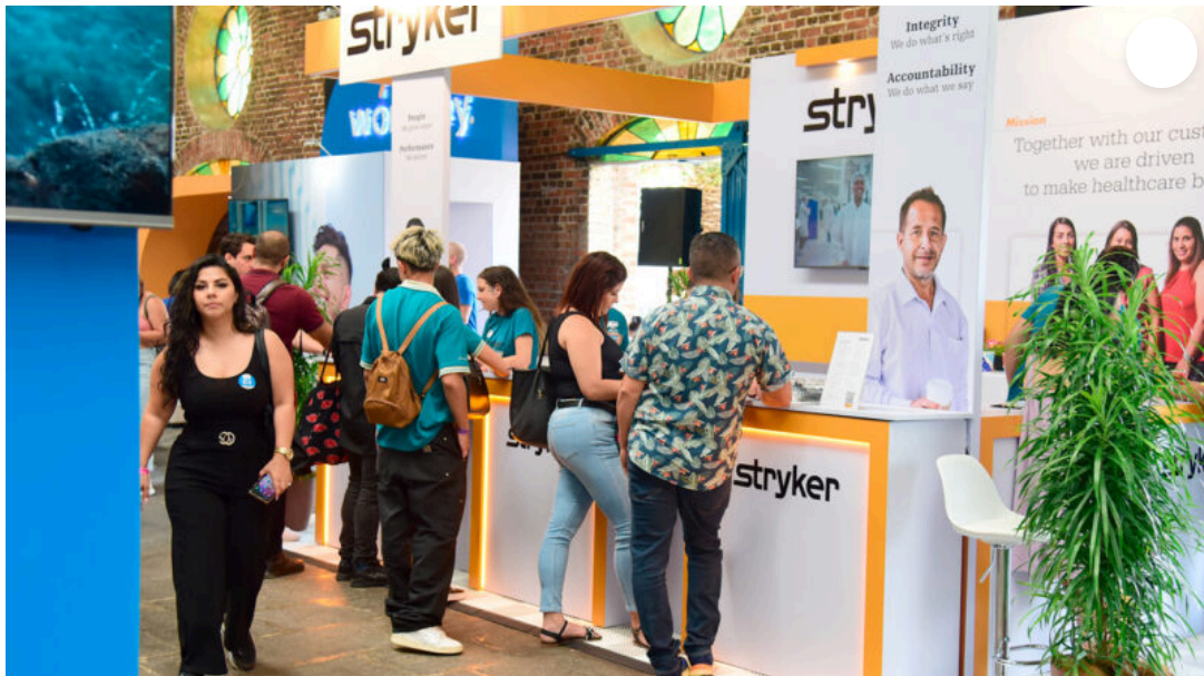
Imagen con fines ilustrativos.