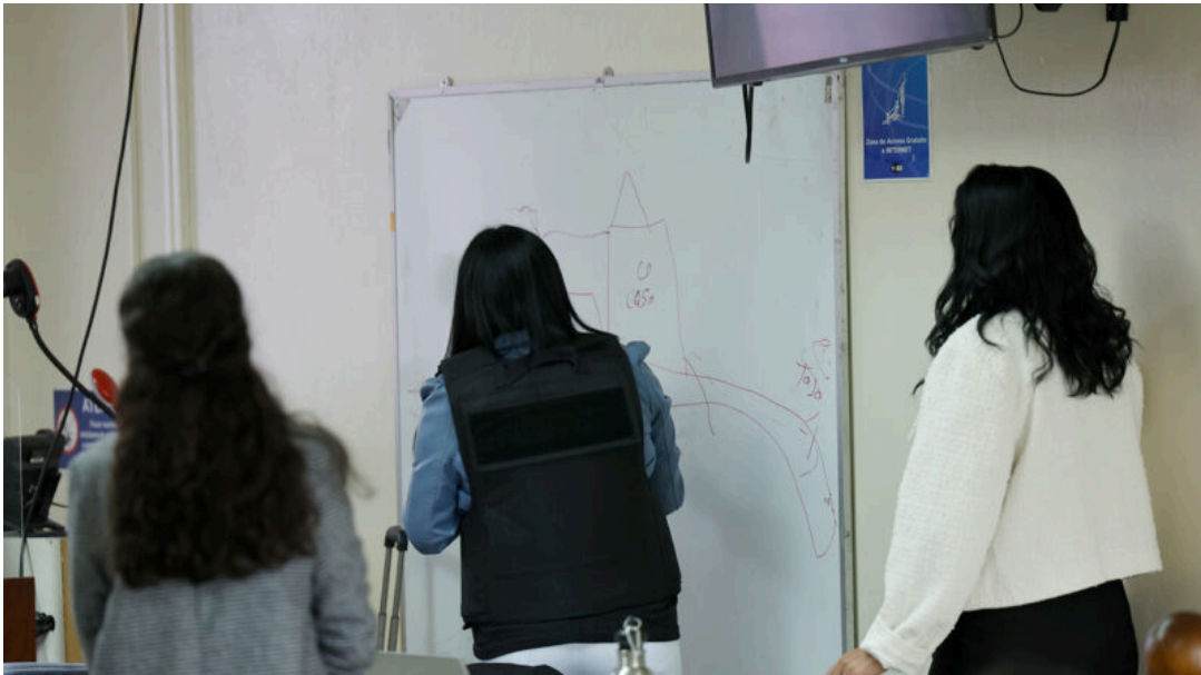
Familiar denunció que sospechoso del doble homicidio era violento.